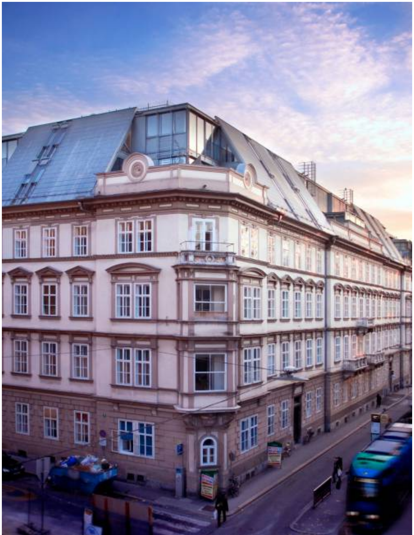
Maiffredygasse 2, Graz