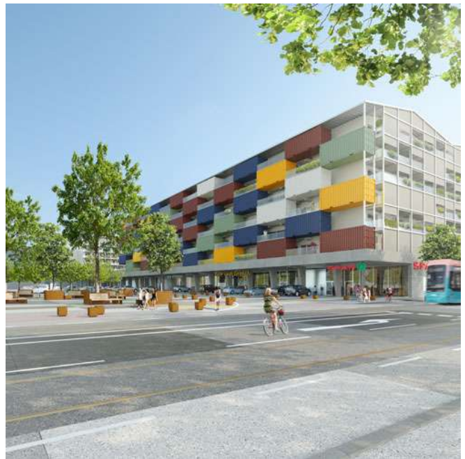
Intelligente Stadtentwicklung (Symbolbild)