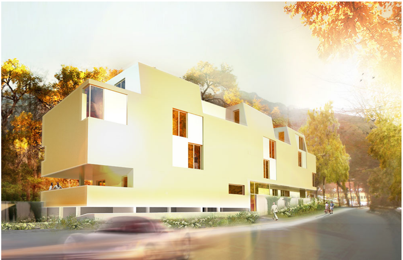
Baiernstraße 44/46, 8020 Graz

Wohnplattform Steiermark: www.wohnplattform.at GSL Wohnen: www.gsl-wohnen.at