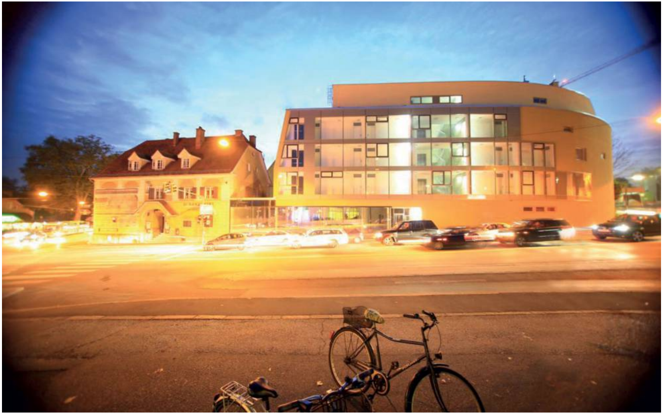
Innenhofansicht, Schanzlwirt, Hilmteichstraße