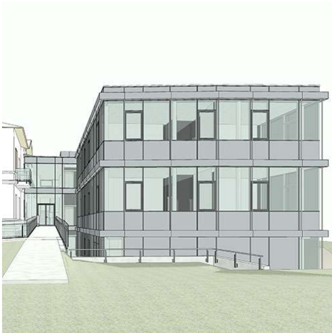
Zugang Leechgasse 29