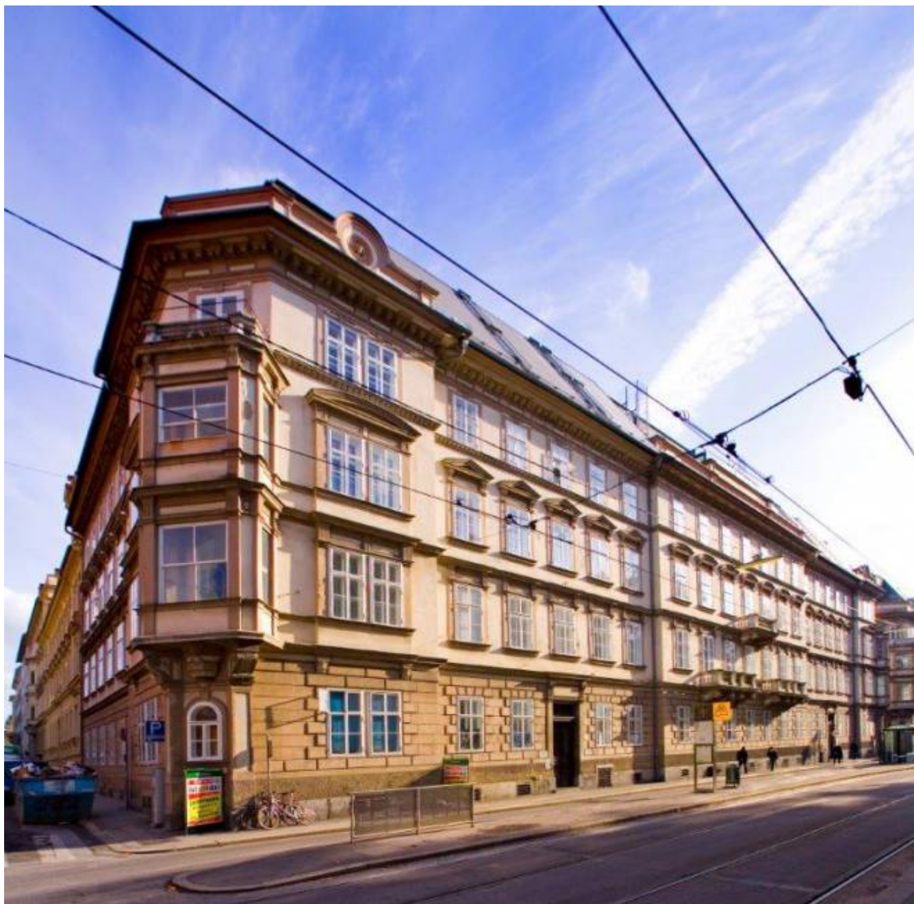
Maiffredygasse 2, 8010 Graz